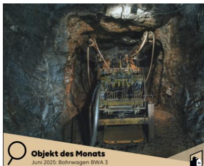
Objekt des Monats Juni 2025: Bohrwagen BWA 3

https://www.ruhr-pott1.de/?fbclid=IwY2xjawKub_tleHRuA2FlbQlxMQABHI9_FaU9kmHDr83YIY1a1aGr1ONK-MRoQ6i0ZPPsa2qshpBBrY-WJk4tKB2CZZ_aem_nzYuGBi6NKpueM8H2eQjHA