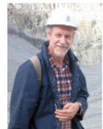
W. Ließmann © Ließmann

Wäre es tatsächlich möglich gewesen, dass Ritter Rammo Pfend am Rammelsberg als Förstler unter seinen Hüten ausrüstet? Ausgehend von Gelehrten mit der Feder, Herr Dr. Wilfried Ließmann, interessiert mit auf eine Reise in verschiedene Ecken der Welt und betrachtet die dortigen Anfänge des Bergbaus. Vielerorts ranken sich darum Sagen und Legenden. Ein markantes Beispiel gibt das große „Berggeschrei“, mit dem vor 500 Jahren die (Wieder-)Aufnahme des Oberrhein-Silberbergbaus begann. Betrachtet werden in diesem Vortrag zunächst bekannte Bergwerke im Erzgebirge, in Skandinavien und im Alpenraum. Anschließend wandelt der Blick zu bedeutenden Erzvorkommen im Oberrhein, wo heute die meisten mineralischen Rohstoffe herkommen. Vorgeleitet werden Beispiele aus Amerika und Australien, wo der Begriff Goldrausch sehr treffend den anfänglichen Run auf wertvolle Bodenschätze beschreibt. Allerdings ist das die Ausnahme, denn in Wirklichkeit ist die Erzsuche meist langwierig und unpopulär, dafür aber sehr erhellend und nur in wenigen Fällen von glänzenden Erfolg gekrönt.