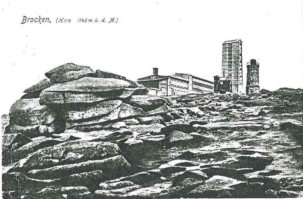
Brocken, (Herz 1142 m ü. d. M.)