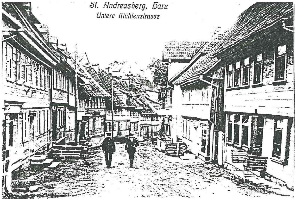
St. Andreasberg, Barz Untere Mühlenstrasse